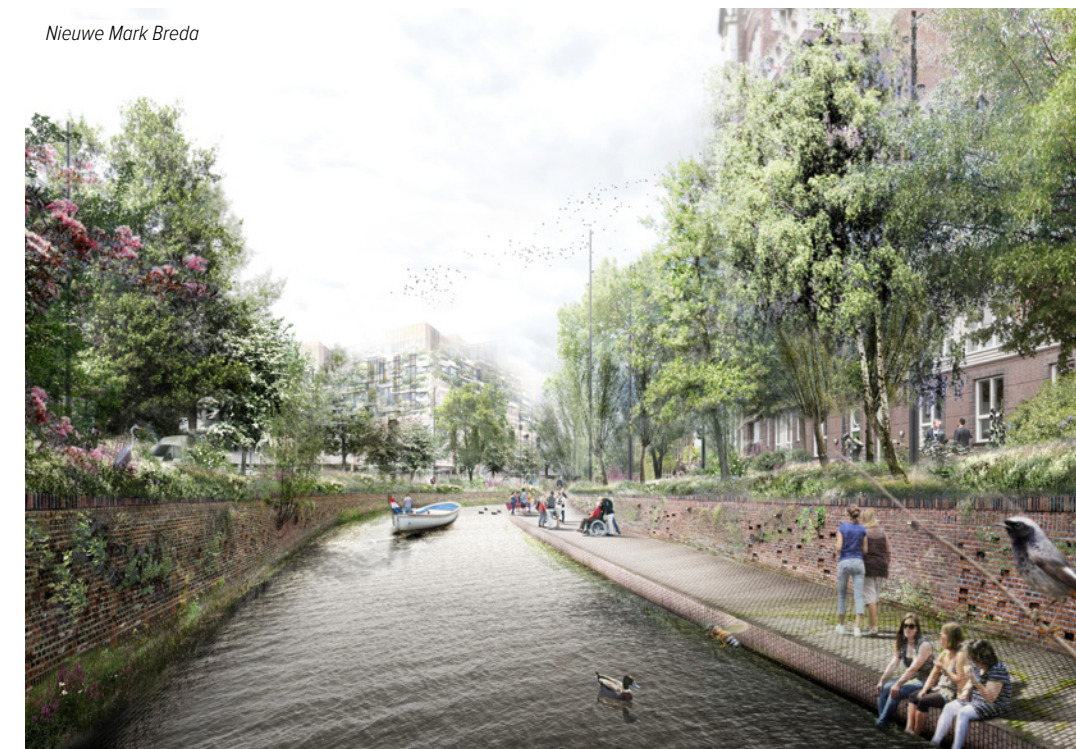
Nieuwe Mark Breda