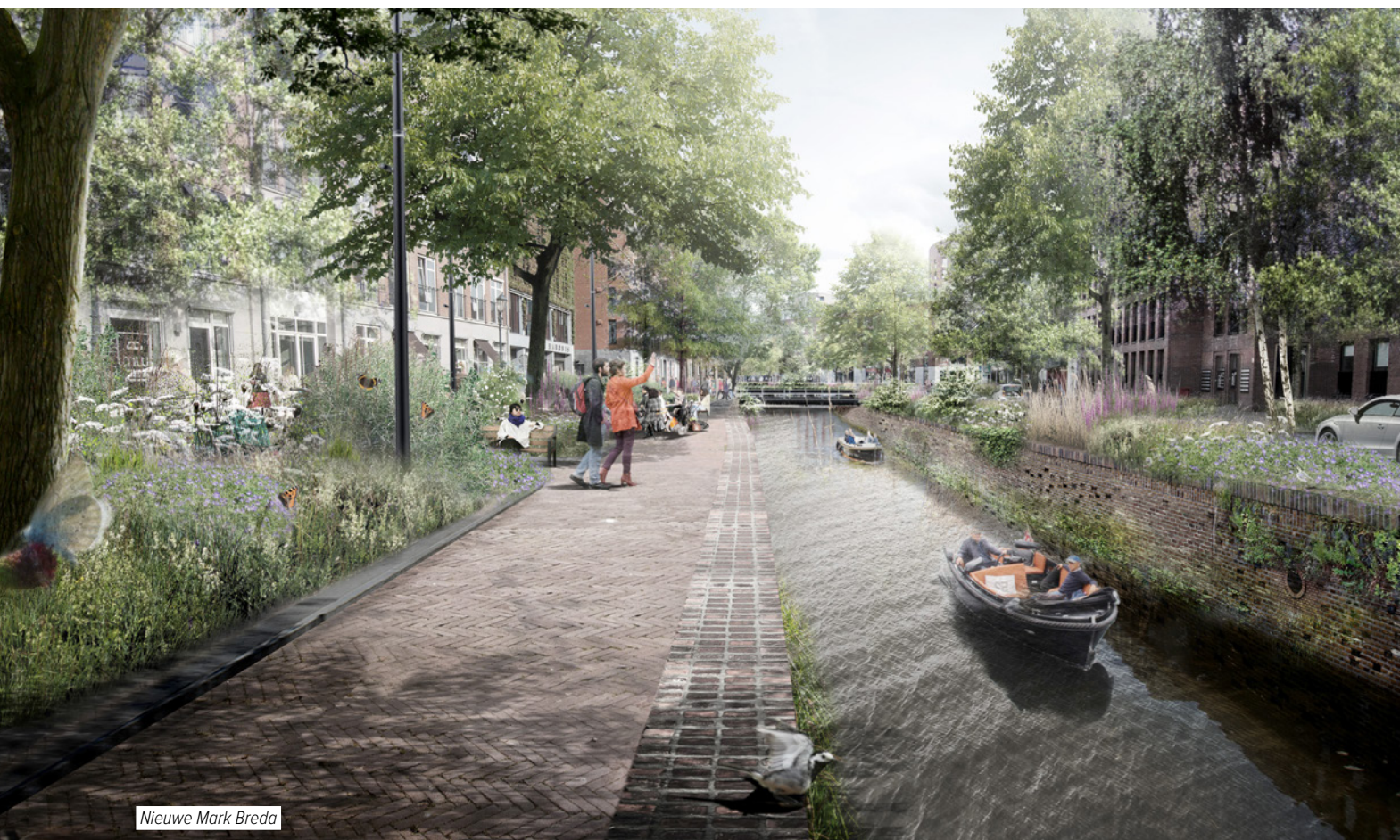
Nieuwe Mark Breda

Texte : Donald Marskamp